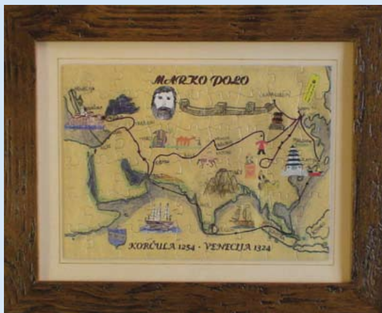
“Marco Polo”, slikovnica Gradske knjižnice Ivan Vidali iz Korčule, 54 komada, dim. 21,5 x 29 cm

Nastala od crteža djece iz Korčule, poklon tamošnje knjižnice