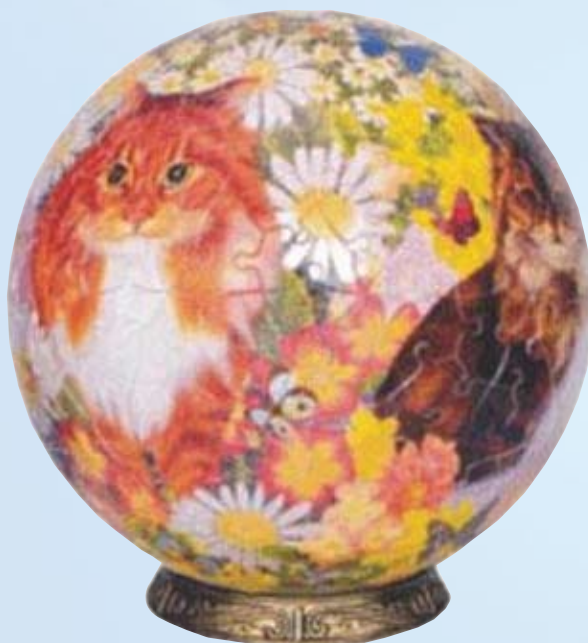
"Cats in Flowers", proizvođač Ravensburger, 240 komada, promjer 15 cm

Izrađena od drvenih dijelova Made of wooden parts