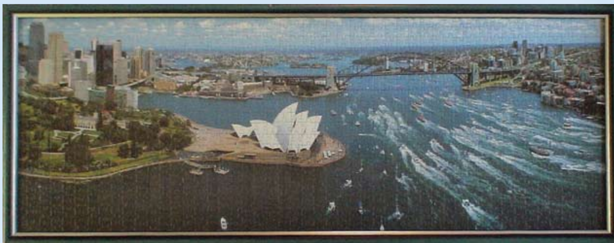
“Sydney”, proizvođač Schmidt Spiele, 1000 komada, panorama, dim. 96 x 34 cm

Neobične panoramske izvedbe sve su veći hit Unusual panoramic designs are a growing hit