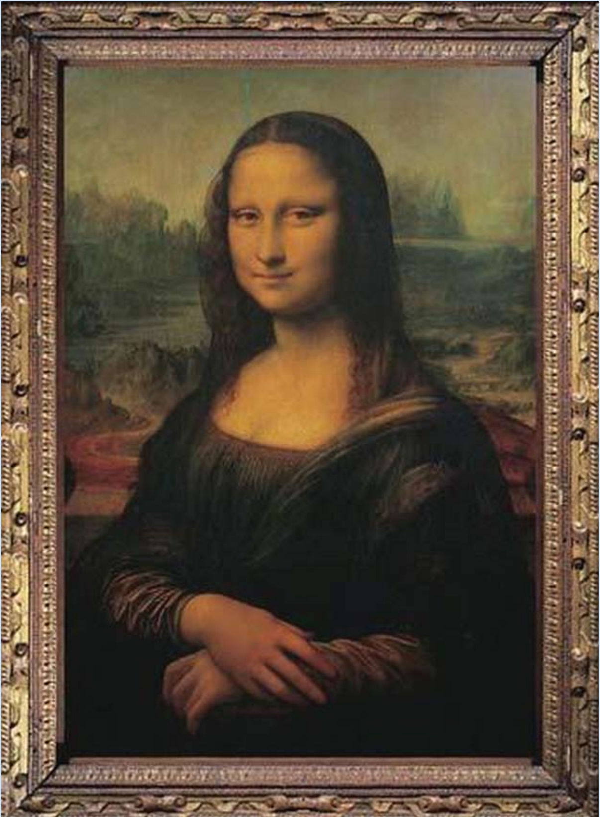
Leonardo Da Vinci: "Mona Lisa", proizvođač Clementoni, Italija, 1500 komada, dim. 67,7 x 47,7 cm