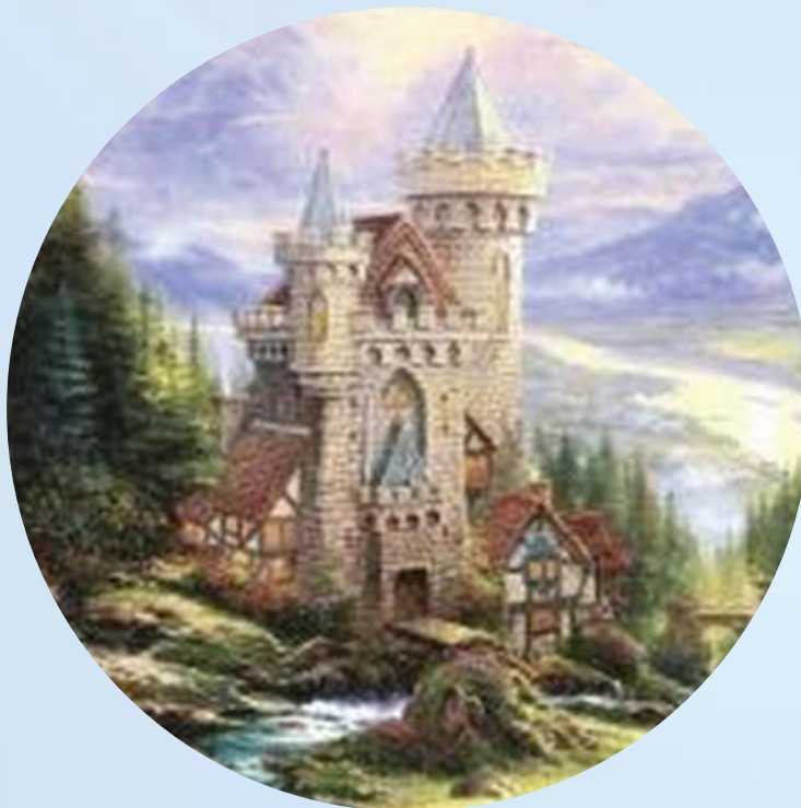
Thomas Kinkade: “Guardian Castle”, proizvođač Schmidt Spiele, Njemačka, 1000 komada, promjer 68,8 cm

Neobične panoramske izvedbe sve su veći hit Unusual panoramic designs are a growing hit