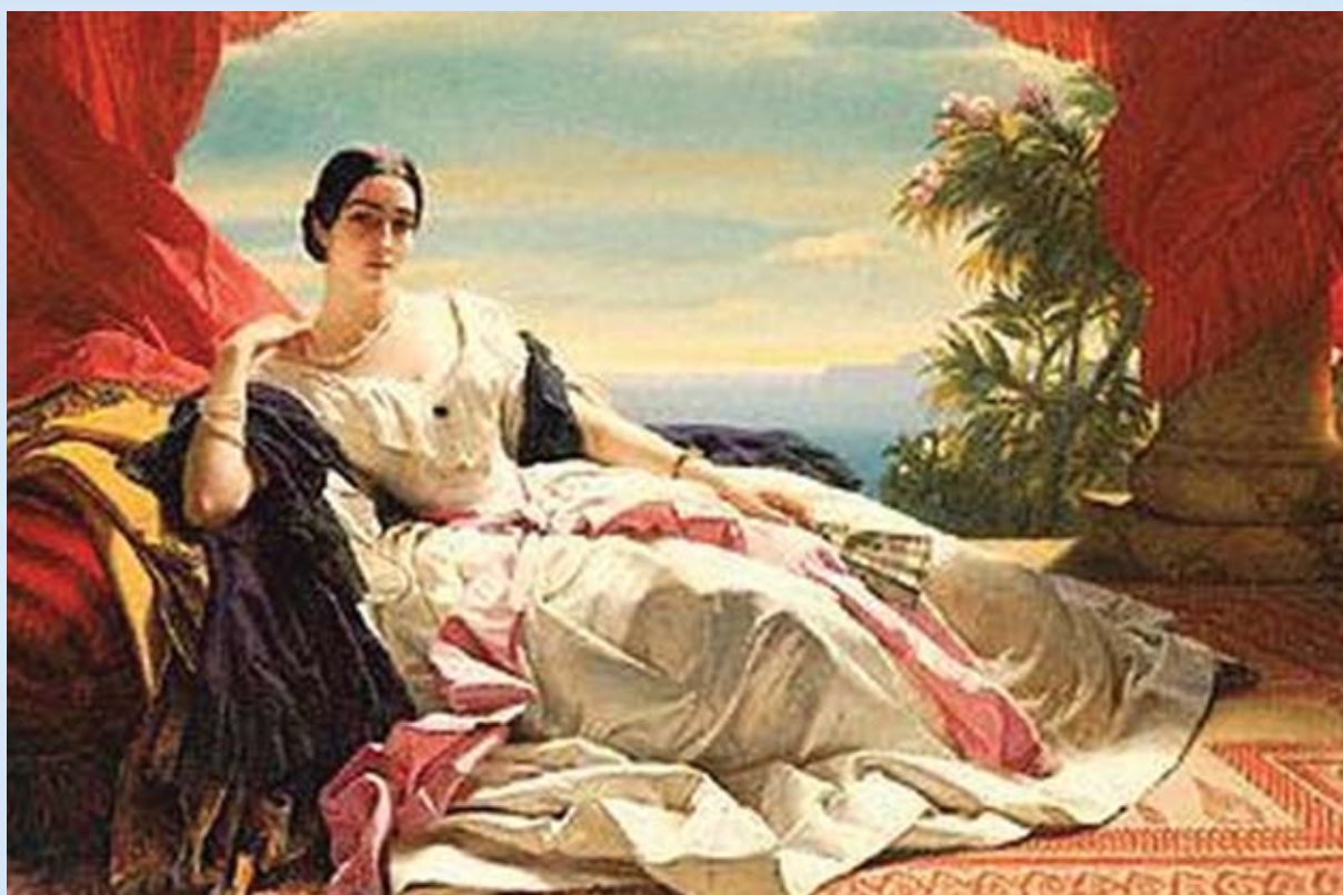
Franz Xaver Winterhalter: "Portrait of Leonilla, Princess of Sayn-Wittgenstein-Sayn", proizvođač Schmidt Spiele, Njemačka, 500 komada, drvena, dim. 51,3 x 41,3 cm

Izrađena od drvenih dijelova Made of wooden parts